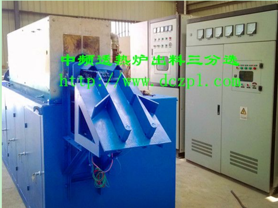
三分选机构（高温料、低温料、合格料分选）