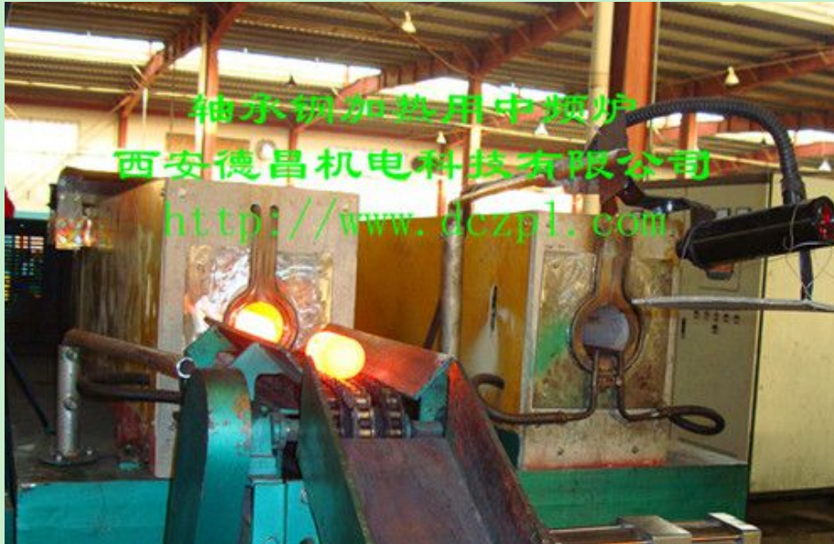
普通中频透热炉出料