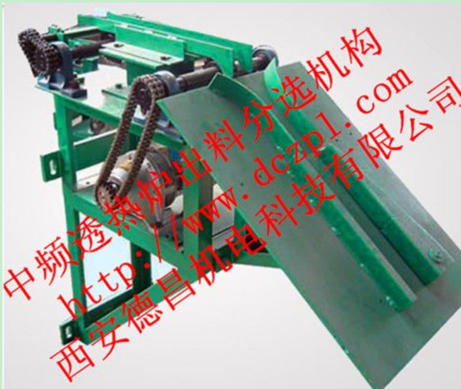
二分选出料机构（合格、不合格工件分选）